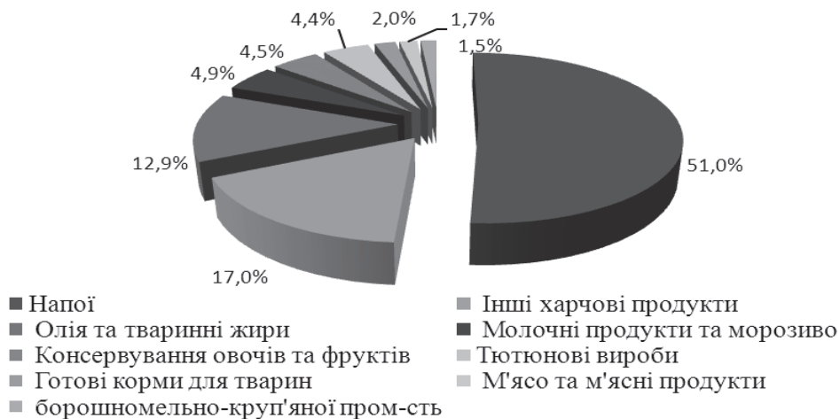
Рис. 6 Структура прямих іноземних інвестицій у виробництво харчових продуктів, напоїв та тютюнових виробів 2013 рік [5]

Аналізуючи металургійне виробництво, то можна стверджувати про те, що протягом останніх років у металургійній промисловості України реалізовано низку масштабних інвестиційно-інноваційних проектів, спрямованих на оновлення та модернізацію виробництва. Про досягнення певних інноваційних зрушень у металургійній галузі України свідчить введення в дію та будівництво нових металургійних підприємств та виробництв з випуску високотехнологічної інноваційної металопродукції з використанням новітнього обладнання та високих технологій.