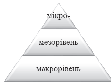
Рис. 1 Рівні конкурентоспроможності

За визначенням, Організації економічного співробітництва і розвитку, конкурентоспроможність – це «рівень, якого країна може досягти, за вільних і справедливих умов, виробляючи товари і послуги, що відповідають вимогам міжнародних ринків, і водночас підтримуючи та підвищуючи реальні доходи протягом тривалого часу» [1, С. 8]. Конкурентоспроможність варто розглядати на трьох рівнях (рис.1).