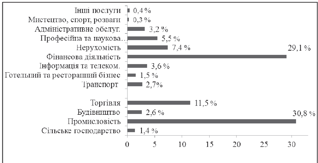
Рис.5 Надходження іноземних інвестицій у I кварталі 2013 р. [9]

За даними Державної служби статистики в I кварталі 2013 року найбільше іноземних інвестицій надійшло у промисловості – 17 171,2 млн. дол. (30,8%), фінансовій діяльності – 16 221,0 млн. дол. (29,1%) та операції з нерухомим майном, орендою, інжинірингу та наданням послуг підприємцям – 4 116,6 млн. дол. (7,4 %). Інвестиційно не привабливими для іноземних інвесторів були такі галузі: сільське, лісове та рибне господарство 773,8 млн. дол. ( 1,4 %), будівництво 1454,80 млн. дол. (2,6%), діяльність транспорту та зв'язку 1 523,9 млн. дол. (3,2%) (рис. 5).