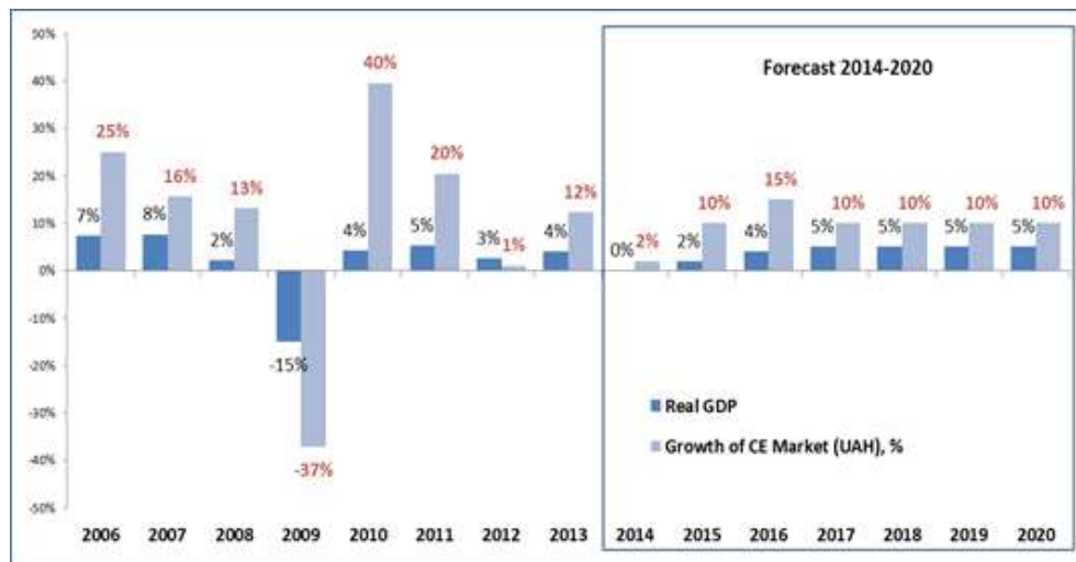
Рис. 3. Приклад прогнозування динаміки ринку побутової електроніки менеджерами торговельної мережі

Не можна не зазначити й наявність певної різниці щодо формування очікувань у чоловіків і жінок, представників різних соціальних груп тощо. Такі особливості механізму інформаційного забезпечення призводять до наявності потужної емоційної складової, випадковостей та появи інших подібних компонентів.