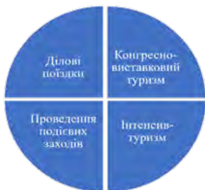
Рис. 2. Види ділового туризму (MICE)

проведенням різноманітних виставкових заходів у сфері ділового туризму ситуація дещо змінилася на краще, що збільшило туристичні надходження в цю галузь.