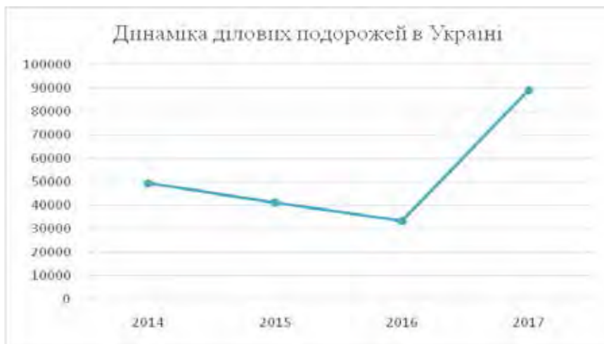
Рис. 3. Динаміка ділового туризму України за 2014–2017 рр.

– сприяння розробленню та впровадженню методології зі збирання, оброблення та надання достовірної статистичної інформації, необхідної для ефективного функціонування й розвитку галузі ділового туризму та МІСЕ;