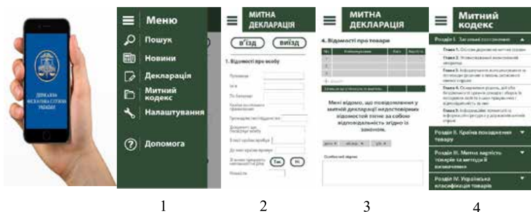
Рис. 2. Загальний вигляд та послідовність заповнення е-декларації громадянина в режимі «Смарт-митниця-громадяни»

Висновки з дослідження та перспективи подальших розвідок у цьому напрямі. Таким чином, із метою поглиблення автоматизації митних процедур для всіх учасників зов-