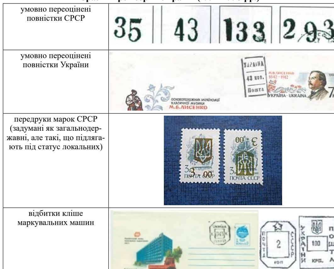
Зразки провізоріїв України (1992–1995 рр.)