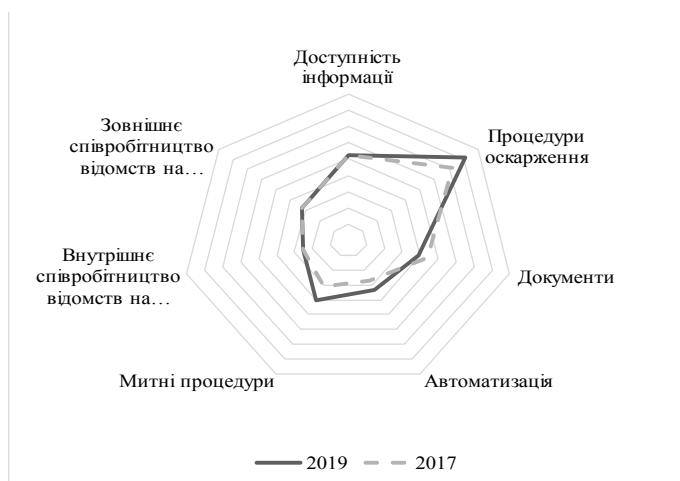
Рис. 1. Індикатори ефективності спрощення процедур торгівлі для України в 2017 та 2019 рр., складено авторами за даними джерела [5]