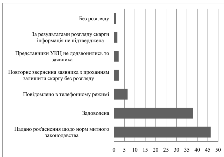
Рис. 2. Статуси скарг, подані заявниками до Державної митної служби, 2020 р., % заявників, [6]

при експорті зменшується, зокрема, у 2020 році було зафіксовано найнижчу частку респондентів, які повідомили про наявність перешкод, тоді як у 2016 році цей показник був у тричі більший. У 2017 році з перешкодами при експорті стикалися 19,3% експортерів, 23,6% у 2018 та 7,9% у 2020 році.