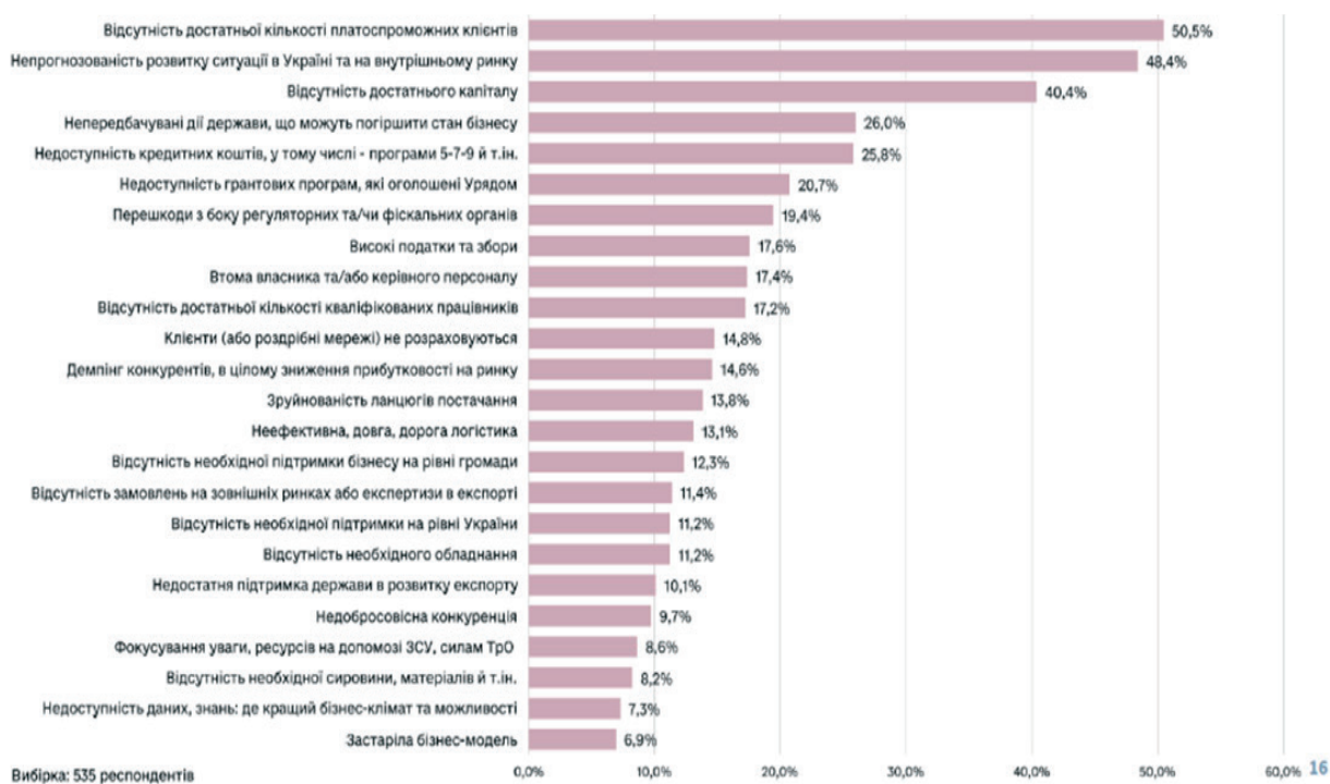
Рис. 2. Проблеми бізнесу станом на січень 2023р.