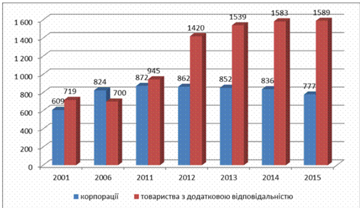
Рис. 2. Динаміка корпорацій та товариств з додатковою відповідальністю протягом 2001 – 2015 рр. (на початок року) [9, с.68]

На наш погляд, така наукотворча дискусія розв’язується досить одноставно виходячи з визначення самої теорії організації як науки, предметом якої є вивчення не лише різноманітних організаційних систем але і організуючих та дезорганізуючих процесів. Звідси автоматично випливає, що здійснення будь яких спеціально організованих впливів на компанію є не що інше як управління нею, отже теорія організації аж ніяк не може бути відокремлена від загального менеджменту й навіть управління в фахових сферах, не є винятком й корпоративне управління.