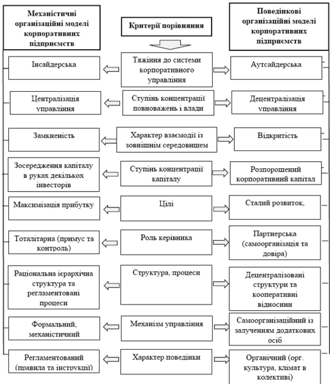
Рис. 4. Порівняльна характеристика механістичних та поведінкових організаційних моделей корпоративних підприємств

На наш погляд, повною мірою віддзеркалює сутність корпоративних підприємств системна організаційна модель, оскільки вона є найбільш гнучка та універсальна, найкращим чином відповідає мінливим ринковим умовам, уособлює в собі одночасно раціональні і поведінкові організаційні процеси в середині підприємств. На базі системної організаційної моделі досягнення цілей відбувається під впливом як централізованих розпоряджень, так і на основі неформального пристосування до вирішення нагальних проблем. Водночас, системна організаційна модель передбачає відкритість до взаємодії із зовнішнім середовищем, а також враховує соціальні аспекти побудови ефективного та конкурентного підприємства.