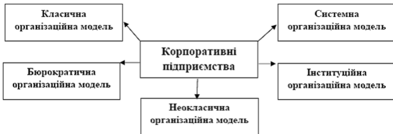
Рис. 3. Вірогідні організаційні моделі корпоративних підприємств

Головним постулатом класичної моделі є уявлення про те, що організація – лише результат дій керівників, які її повністю конструюють і володіють нею [8, с.22]. Звісно таке твердження може бути об'єктивним лише стосовно повних та командитних господарських товариств, де пайщики (партнери) бізнесу безпосередньо виконують функції управлінців і аж ніяк не притаманне корпоративним підприємствам, що відрізняються відокремленням володіння від поточного управління. За такої класичної моделі підприємство розглядається як механістична система, в якій людині відводиться роль «гвинтика» з відстороненням від її особистісних прагнень та інтересів, а також як замкнута система, розвиток якої визначається виключно внутрішніми удосконаленнями поза врахування зовнішнього середовища. Це недоліки класичної моделі організації, які не дозволяють напевне покласти її в основу сучасного корпоративного підприємства. Разом з тим, саме класична та бюрократичні моделі відрізняються такими важливими якостями: