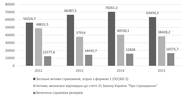
Рис. 1. Динаміка активів та обсягів страхових резервів за 2012-2015 рр., млрд. грн.

Динаміку активів та обсягів страхових резервів страховиків за 2012 – 2015 рр. зображено на рис. 1.