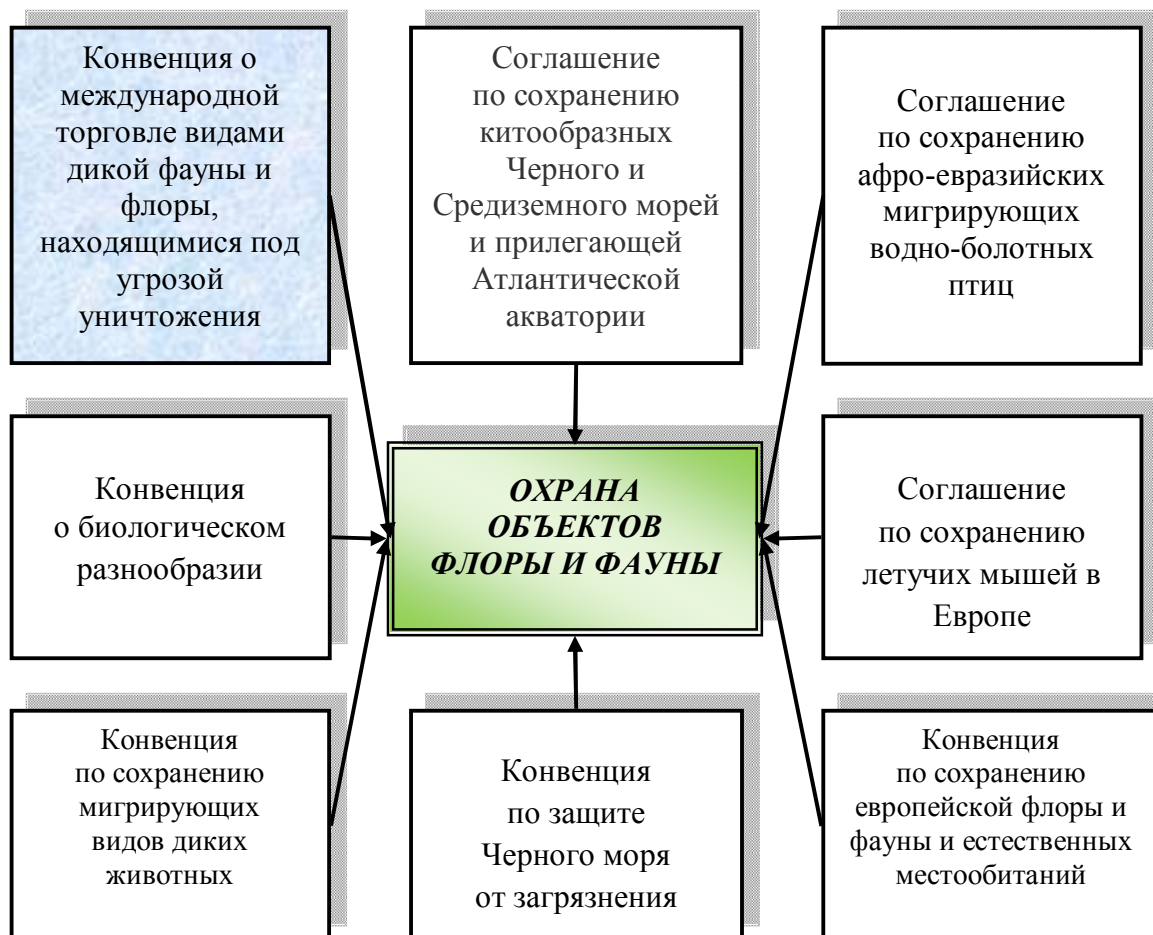
Рис. 1. Основные международные конвенции и соглашения Организации Объединенных Наций по охране окружающей среды, наиболее актуальные для Украины

по окружающей среде (ЮНЕП), Международным союзом по охране природы (МСОП) и Всемирным фондом дикой природы (WWF).