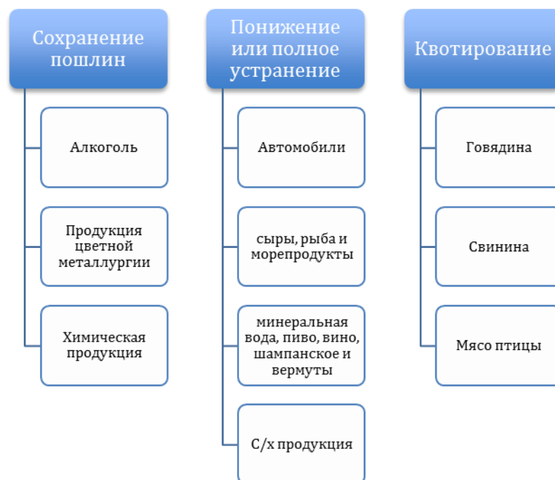
Рис. 2. Система тарифных преференций и квот после вступления России в ВТО