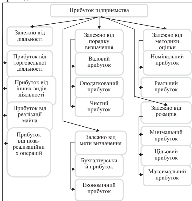
Рис. 2. Види прибутку підприємства, що використовуються в обліку, аналізі, плануванні [3]

Обсяг прибутку за кожним видом діяльності формується як сальдо доходів та витрат на її проведення.