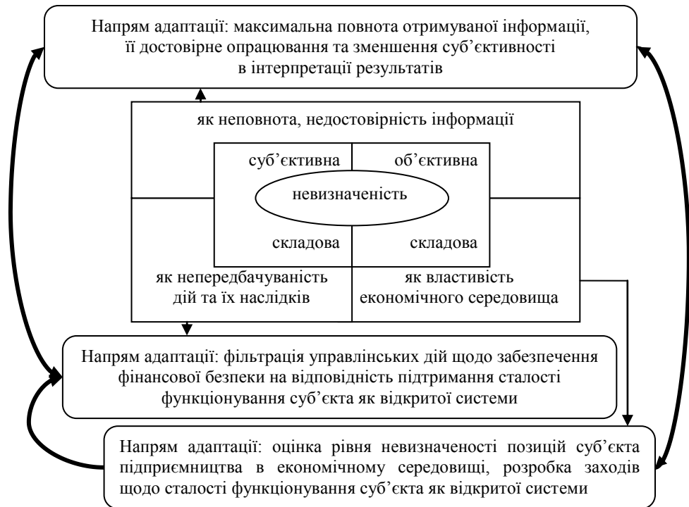
Рис. 1. Напрями адаптації фінансового механізму фінансової безпеки суб'єкта підприємництва до умов невизначеності

Виклад основного матеріалу. Оскільки невизначеність – поняття комплексне, то й адаптація фінансового механізму фінансової безпеки суб'єктів підприємництва до умов невизначеності має здійснюватись постійно у кількох напрямках (рис. 1), оскільки економічне середовище також змінюється. Для забезпечення саме безперервності процесу адаптації розпочинатись вона має з адаптації до інформаційної невизначеності чи адаптації до невизначеності як властивості економічного середовища, що дасть змогу замкнути одночасно кілька циклів адаптаційних дій.