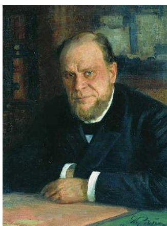
А. Ф. Кони

Эти обстоятельства резко повысили требования к звучащей в зале суда речи и способствовали появлению яркого созвездия блестящих судебных ораторов, среди которых: А. Ф. Кони, Ф. Н. Плевако, а также В. Д. Спасович – известный белорусский юрист, С. А. Андреевский – украинский юрист. Андреевский по долгу службы был знаком со Спасовичем, который больше занимался делами политической направленности, а Андреевский – уголовной.