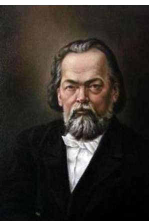
Ф. Н. Плевако