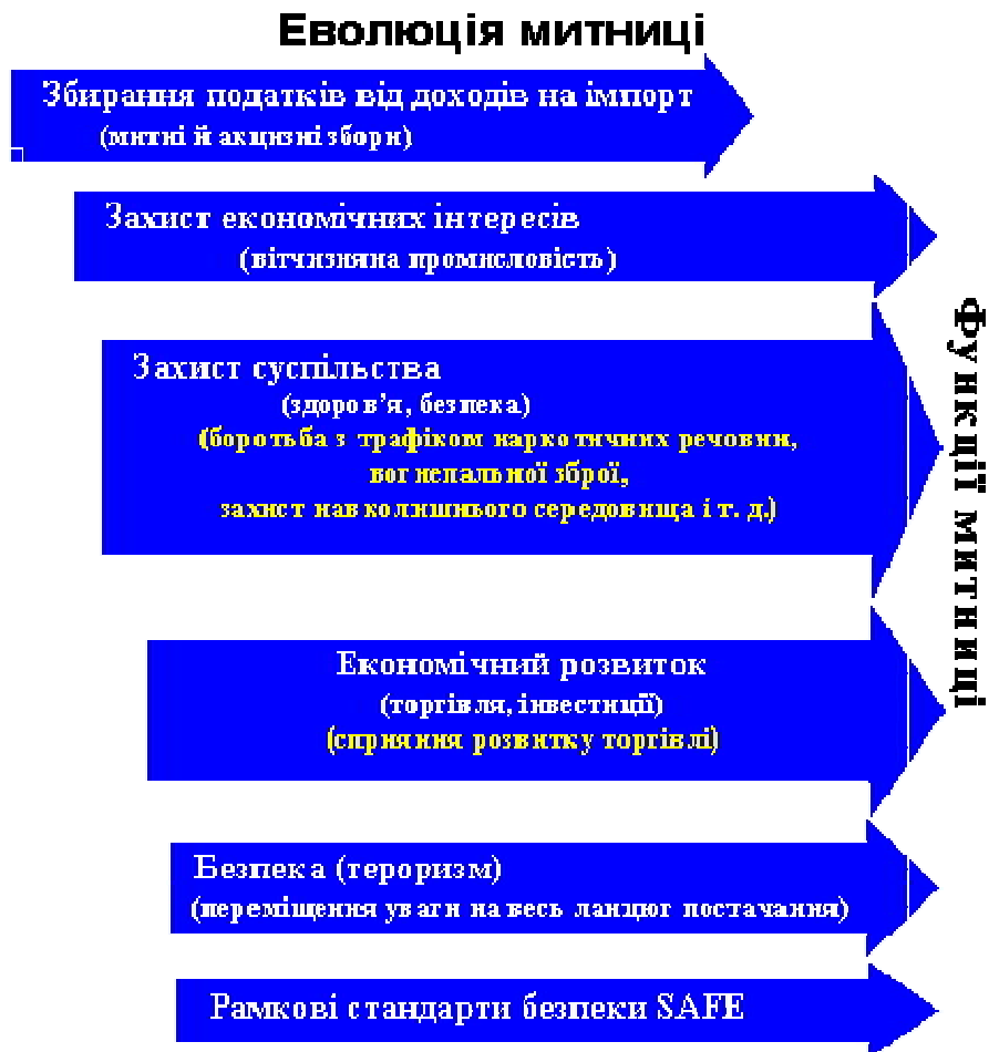
Рис. 2. Схема еволюції митниці

Висновки. Підсумовуючи сказане, слід зазначити, що світовий та європейський досвід у галузі митної справи, її окремих напрямків, наприклад боротьби з контрабандою, є важливим інструментом пошуку інформації, узагальнення досвіду та вироблення на цій основі національних інструментів і механізмів забезпечення безпеки держави. На сучасному етапі ключову роль у цьому процесі адаптації міжнародного досвіду відіграють Рамкові стандарти безпеки SAFE Всесвітньої митної організації.