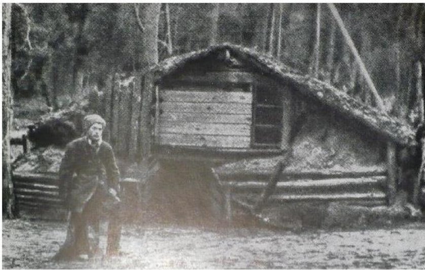
Прикордонна застава на Далекому Сході після громадянської війни. 1923 рік.

Чотири роки громадянської війни сприяли посиленню позицій контрабандистів у регіоні. Ось чому радянським прикордонникам треба було розпочати охорону державного кордону на Далекому Сході майже з нуля. В цей же час на території сусідніх держав знаходились досвідчені офіцери та нижчі чини російської армії, в тому числі і прикордонники. Більшість із них були, звичайно, не вдоволені змінами в своєму становищі, а тому охоче йшли до Б. Савінкова, у його відновлений “Народный союз защиты родины и свободы”. Озброєні загони савінковців неодноразово перетинали державний кордон у західних губерніях, де здійснювали “налеты на исполкомы, кооперативы, склады, пускали под откос поезда,