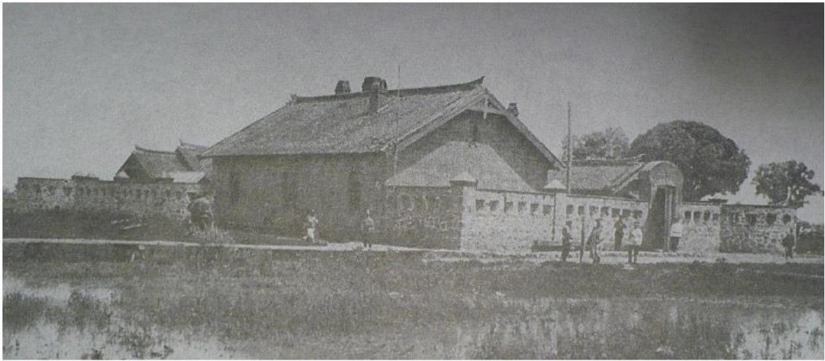
Тип казарм прикордонної варті на Далекому Сході. Початок XX ст.