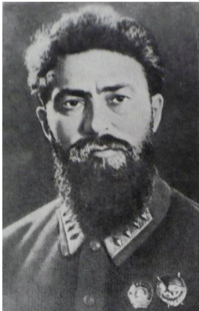
Гамарник Я.Б. (1894-1937 рр.)

Але в другій половині XIX ст 9 . проголосити землі, які знаходяться в зоні перетину інтересів низки європейських країн, своїми було