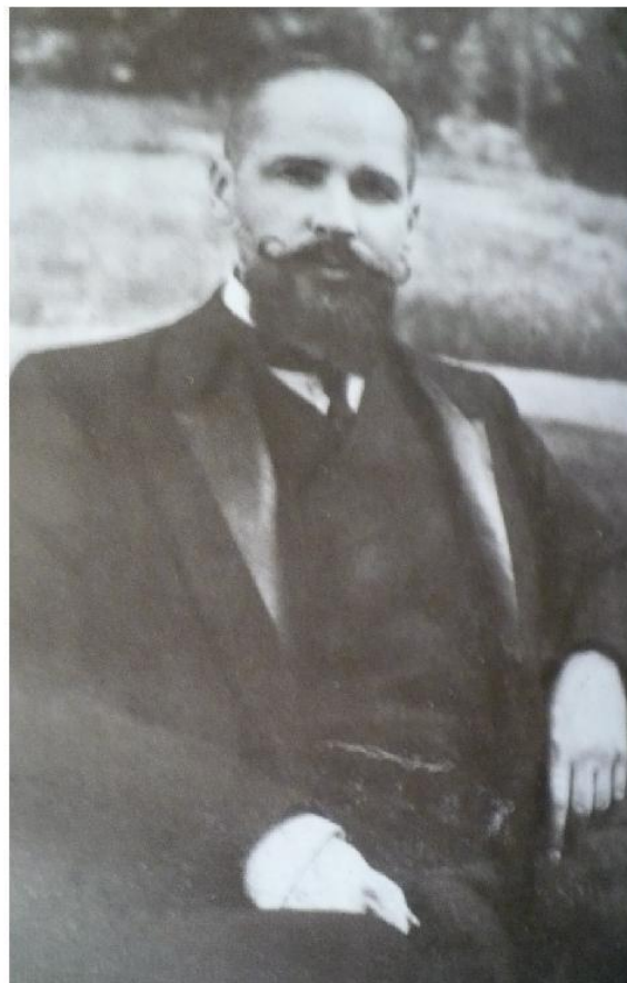
Століпін П.А. (1862-1911 рр.)