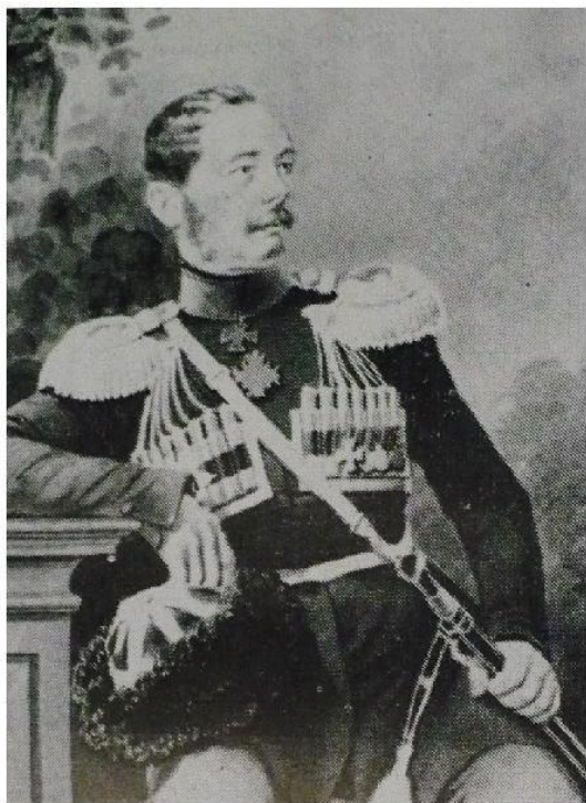
Муравйов - Амурський М.М. (1809-1881 рр.)

Владивосток з 1883 по 1902 роки став головним пунктом прийому 98734 переселенців (71363 з яких вийшли з території сучасної України). 8