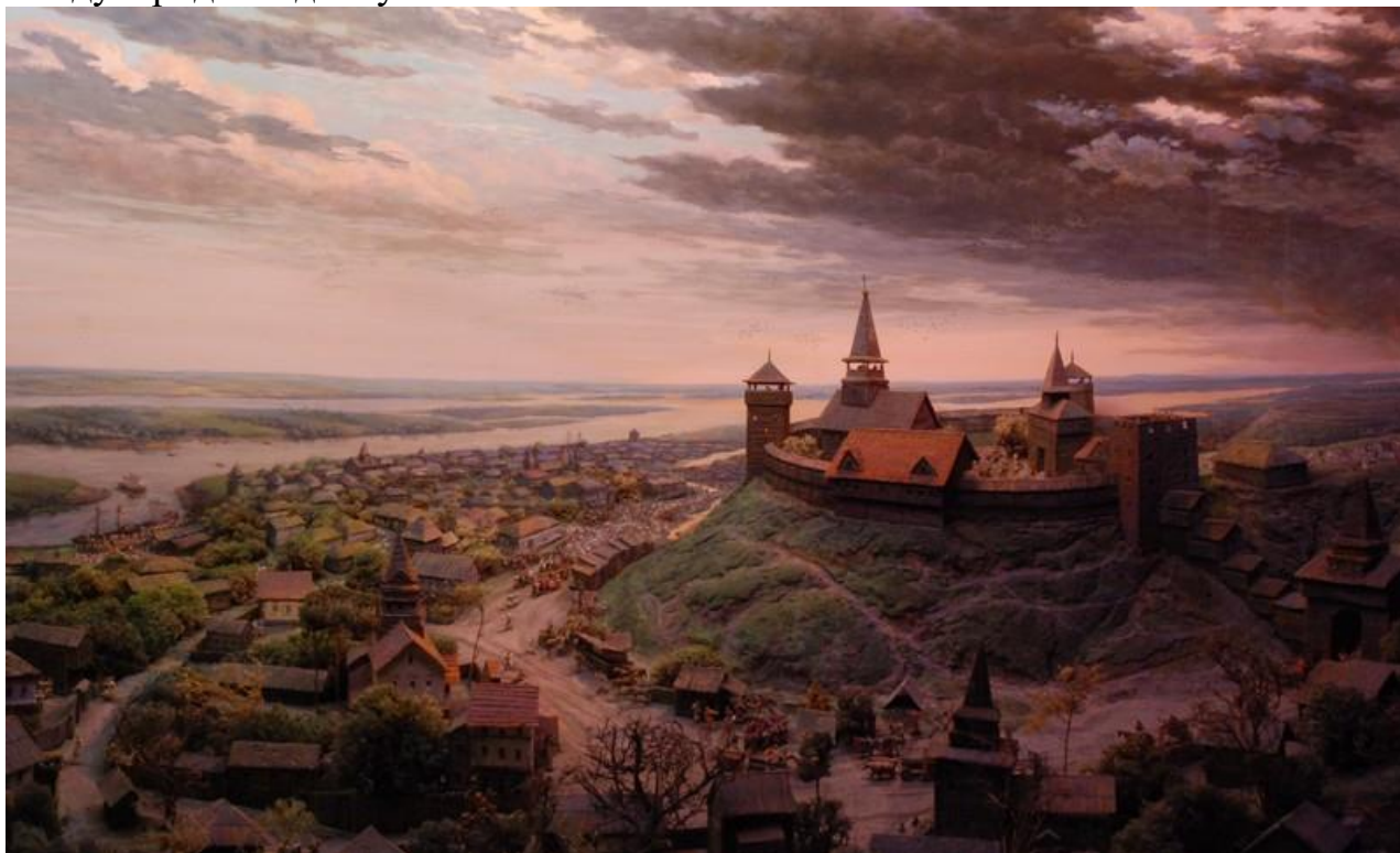
Рисунок 1. Казанский А.В. “Черкассы XVI в.” Черкасский областной краеведческий музей.

Большинство, не зная своей истории, оказываясь в глупом положении во время международных дискуссий.