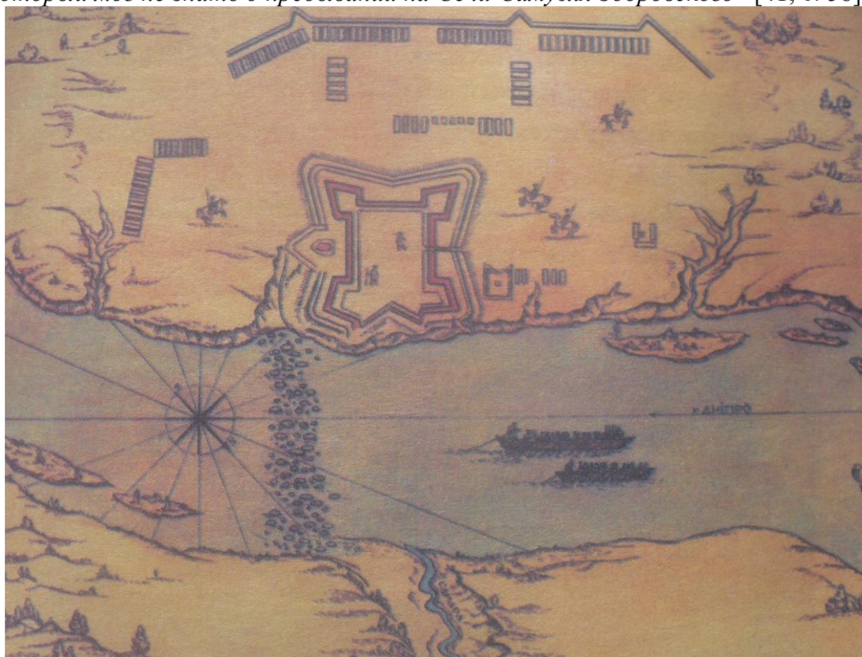
Рисунок 9. План крепости Кодак на Днепре.

Но тут же писатель делает авторское примечание: “Это слова Маскевича, который мог не знать о пребывании на Сечи Самуэля Зборовского” [41, с. 58].