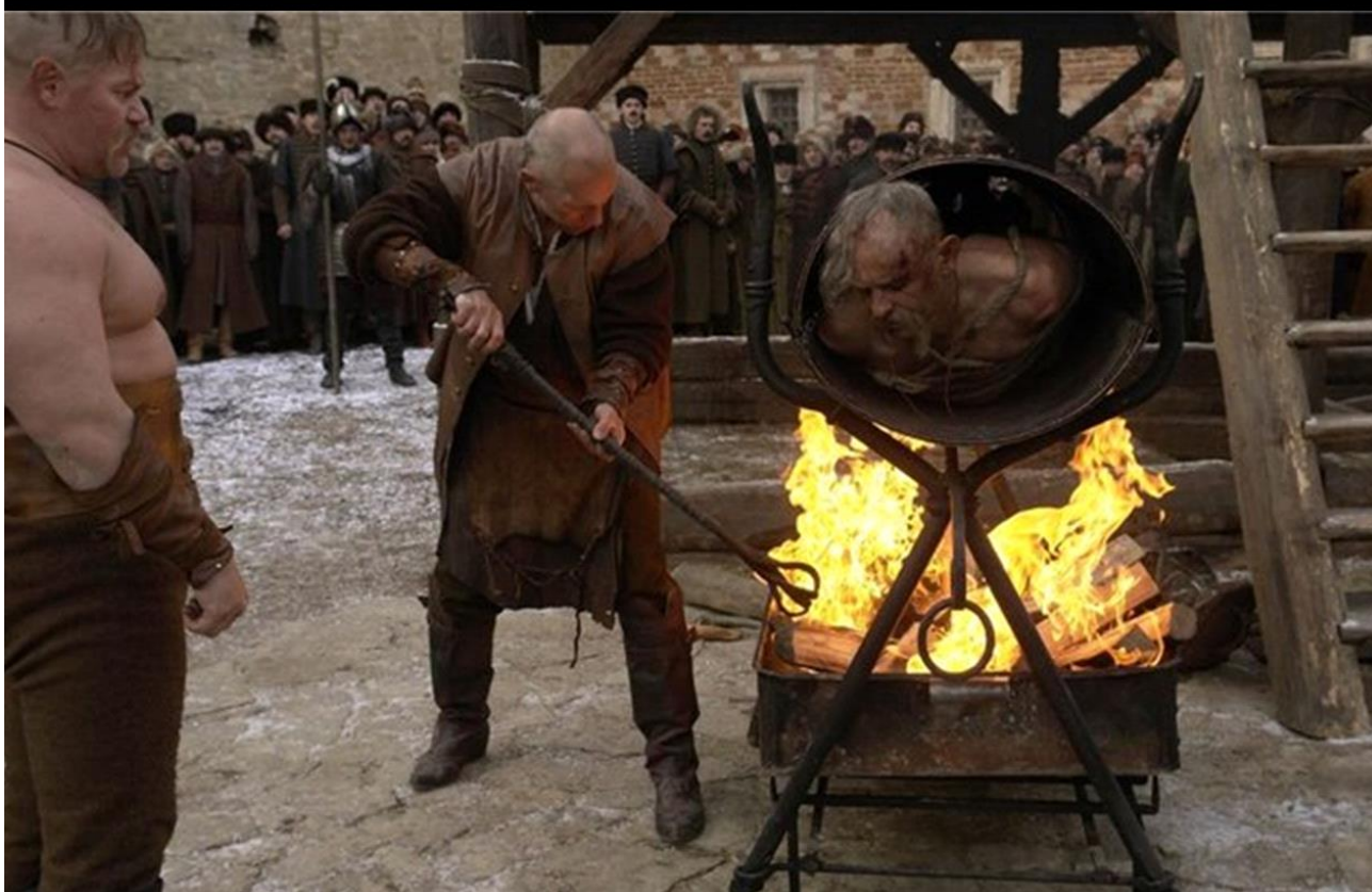
Рисунок 8. Иллюстрации Евгения Кибрика к повести Н.В. Гоголя “Тарас Бульба” 1945 г. (вверху). Казнь казаков в Варшаве. Кадр из художественного фильма В.В. Бортко “Тарас Бульба” 2009 г. (внизу).