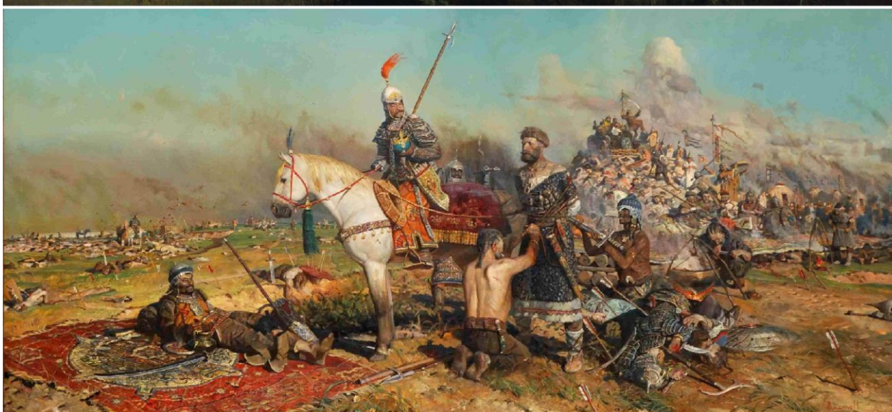
Рисунок 3. Васнецов В.М. “После побоища Игоря Святославовича с половцами” 1880 г. Государственная Третьяковская галерея, Москва (вверху). Рыженко П.В. “Калка” 1996 г. Собственность семьи художника (внизу).

Столетиями здесь звенели мечи, а не косы, позволяя собирать смерти обильную жатву. Не случайно 20 июня 1920 года Максимилиан Волошин начал своё стихотворение “Дикое поле” такими словами: