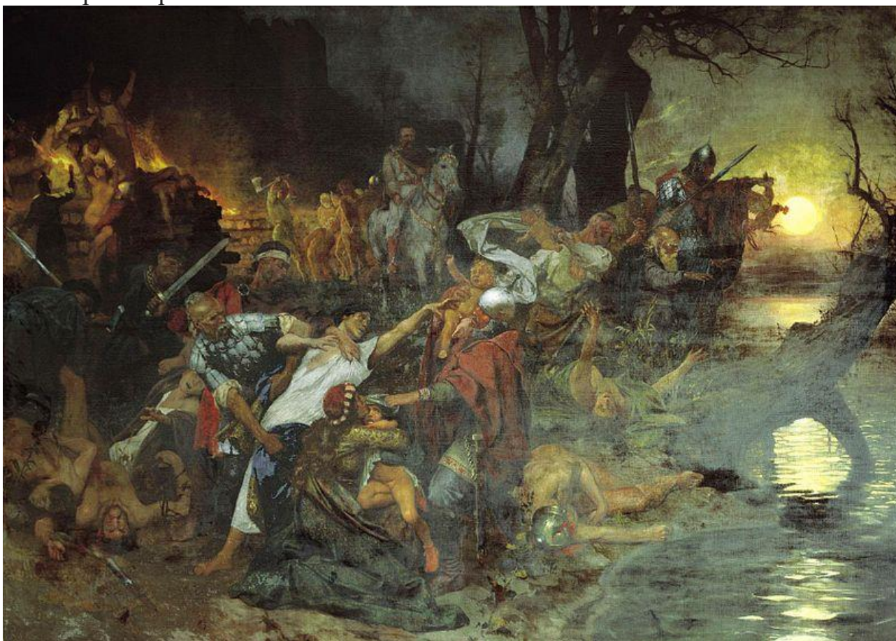
Рисунок 2. Г.И. Семирадский “Тризна дружинников Святослава после боя под Доростолом в 971 году”. 1880-е годы. Государственный Исторический музей, Москва.

походах, как пардус 1 , и много воевал. В походах же не возил за собой ни возов, ни котлов, не варил мяса, но, тонко нарезав конину, или зверину, или говядину и зажарив на углях, так ел. Не имел он и шатра, но спал, подстелив потник, с седлом в головах, такими же были и все прочие его воины. И посылал в иные земли со словами: «Иду на вы!»» [3, с. 16]. Так формировался образ князя-воина, князя-тактика, но не князя-политика и тем более не князя-стратега, способного просчитать последствия своих действий. Так, разгромив Хазарский Каганат в походах с 954 по 969 годы, князь Святослав уничтожил плотину, которая прикрывала его княжество от диких степных племён. Не секрет, что хрестоматийной стала и фраза из послания киевлян своему князю: “Ты, княже, ищешь чужой земли, а свою землю покинул. Если не придёшь и не защитишь нас, а нас то возьмут нас печенеги!” [3, с. 28]. Святослав в это время искал славы на Балканах, где оставил о себе не самую добрую память, о чём не принято вспоминать на территории Украины. По приглашению императора Никифора II Фока, воюя в 968 году против болгар, а с августа 969 года в союзе с болгарами против Византии.