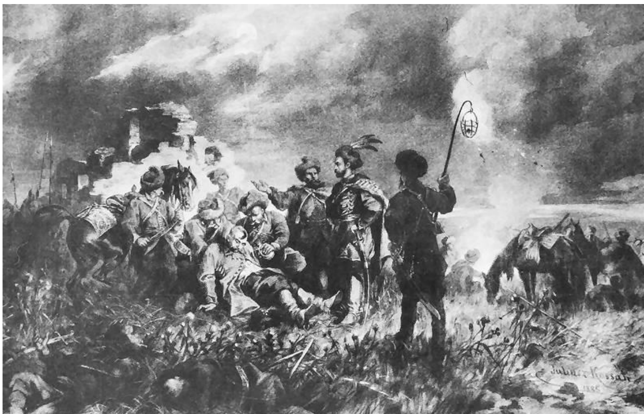
Рисунок 6. Юлиуш Коссак “Встреча Яна Скшетуского и Хмельницкого”. Иллюстрация к роману Г. Сенкевича “Огнём и мечом”.

В польской исторической и художественной литературе господствует мнение, отрицаемое украинской исторической школой, что к повторному экономическому освоению этого края приступили польские князья Вишневецкие в конце XVI – первой половине XVII столетия, организовав не только строительство замков и укреплений, но и переселяя сюда своих крестьян, ремесленников и арендаторов.