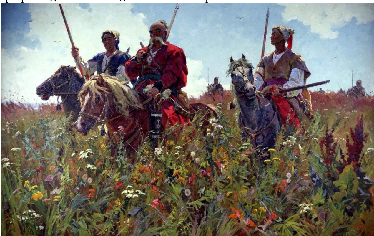
Рисунок 4. А.П. Бубнов “Тарас Бульба”. Челябинский государственный музей изобразительных искусств.

Картины В.М. Васнецова (1848-1926) и П.В. Рыженко (1970-2014) прекрасно дополняют созданный поэтом образ.