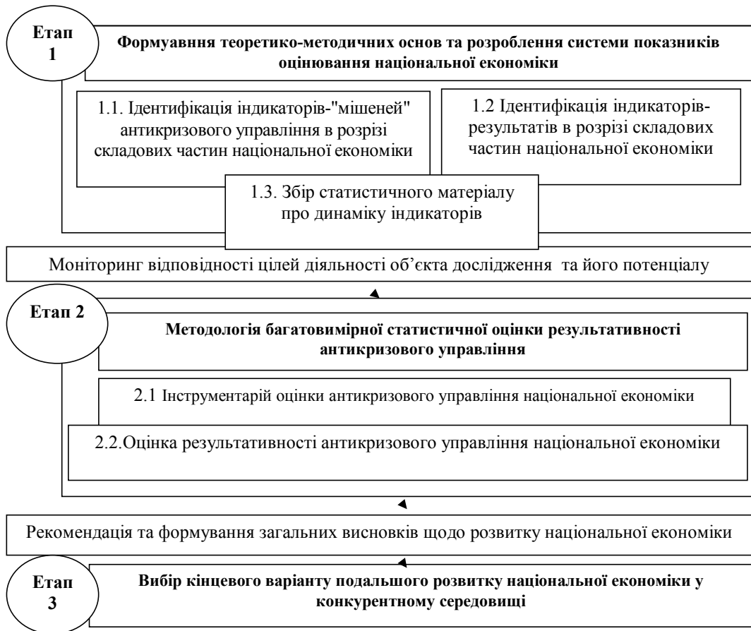
Рис. 1. Методика оцінки результатів антикризового управління національної економіки