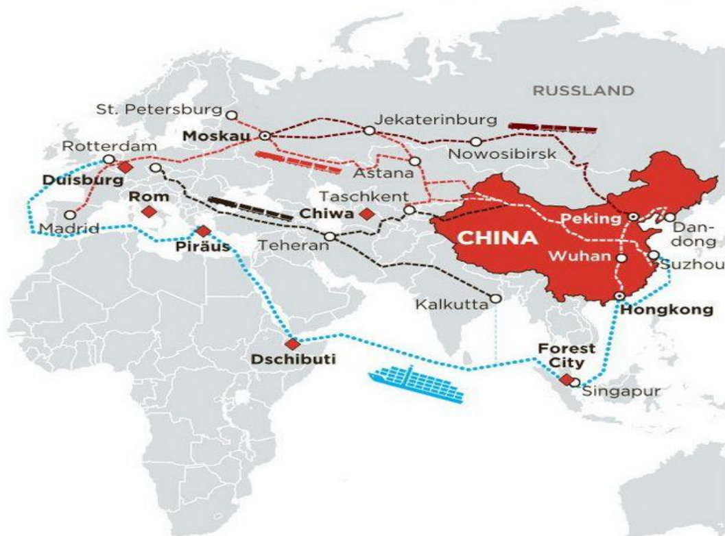
Рис. 4. Новий Шовковий Шлях з Китаю в Європу [8]