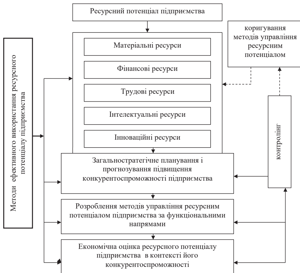
Рис. 3. Механізм управління ресурсним потенціалом для підвищення конкурентоспроможності підприємства