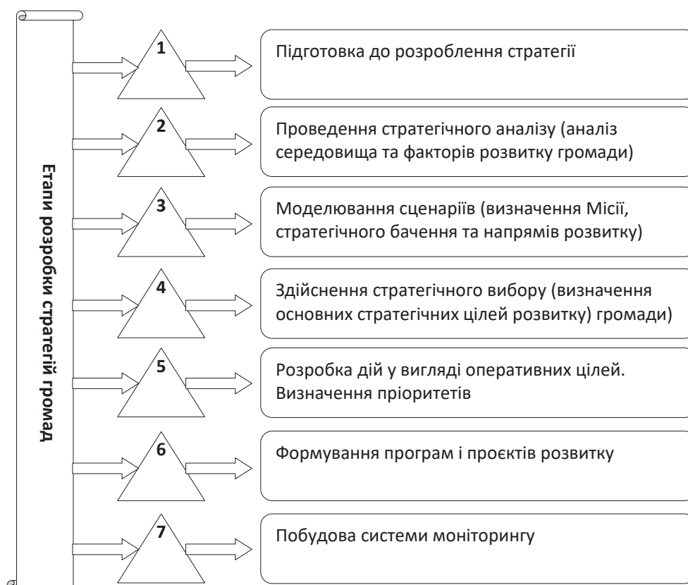
Рис. 1. Блок-схема організації процесу стратегічного планування ТГ

Визначальним у Стратегії розвитку України до 2030 року [14] є інноваційне спрямування розвитку, яке ґрунтується на активному використанні знань і наукових досягнень, стимулюванні інноваційної діяльності, створенні сприятливого інвестиційного клімату, оновленні виробничих фондів, формуванні високотехнологічних видів діяльності та галузей економіки, підвищенні