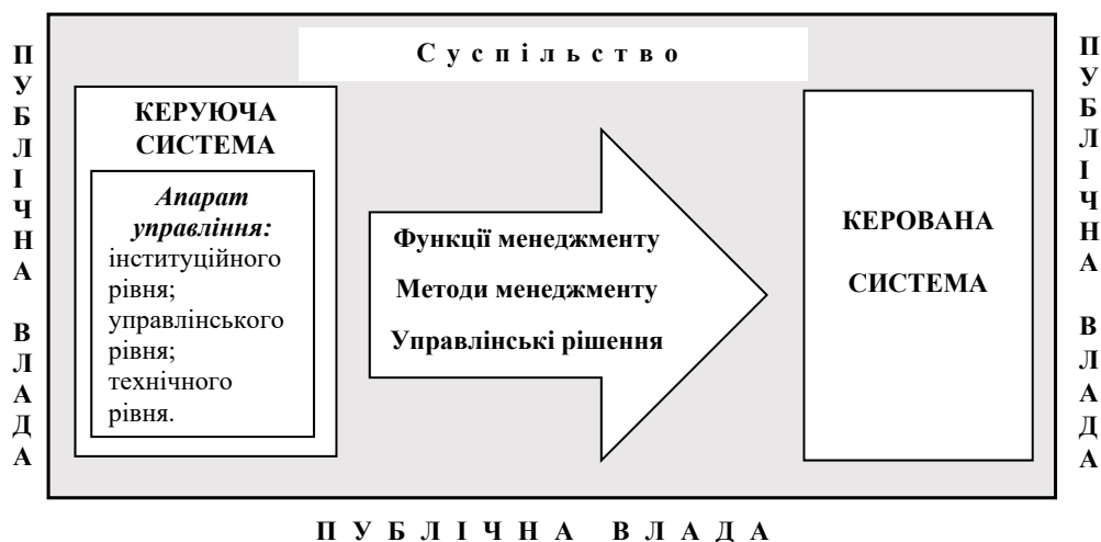
Рис. 1. Процес функціонування публічної влади в країні