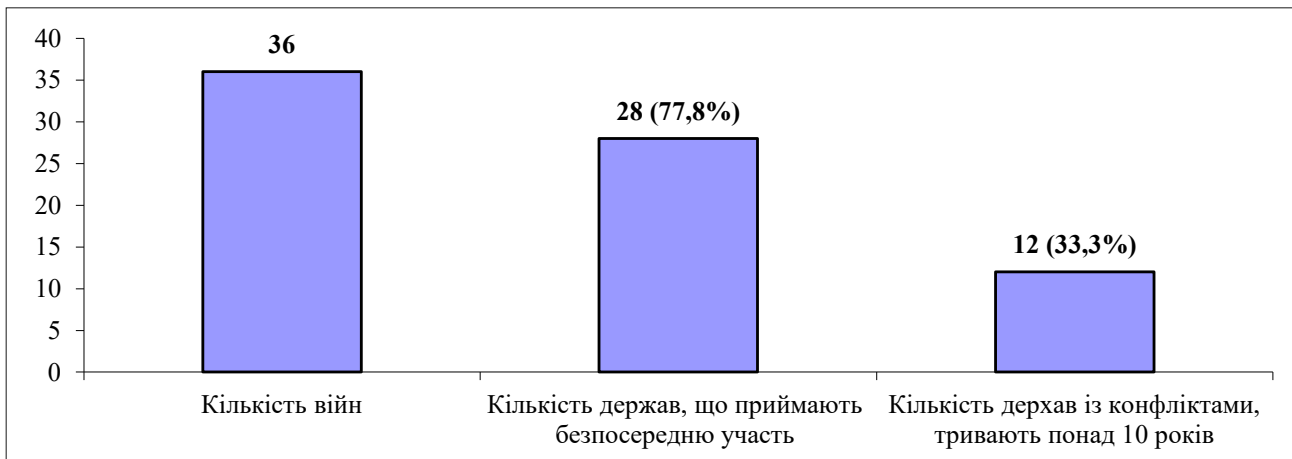
Рис. 1. Кількісні параметри наслідків політичних міжнародних конфліктів станом на 2019 р.