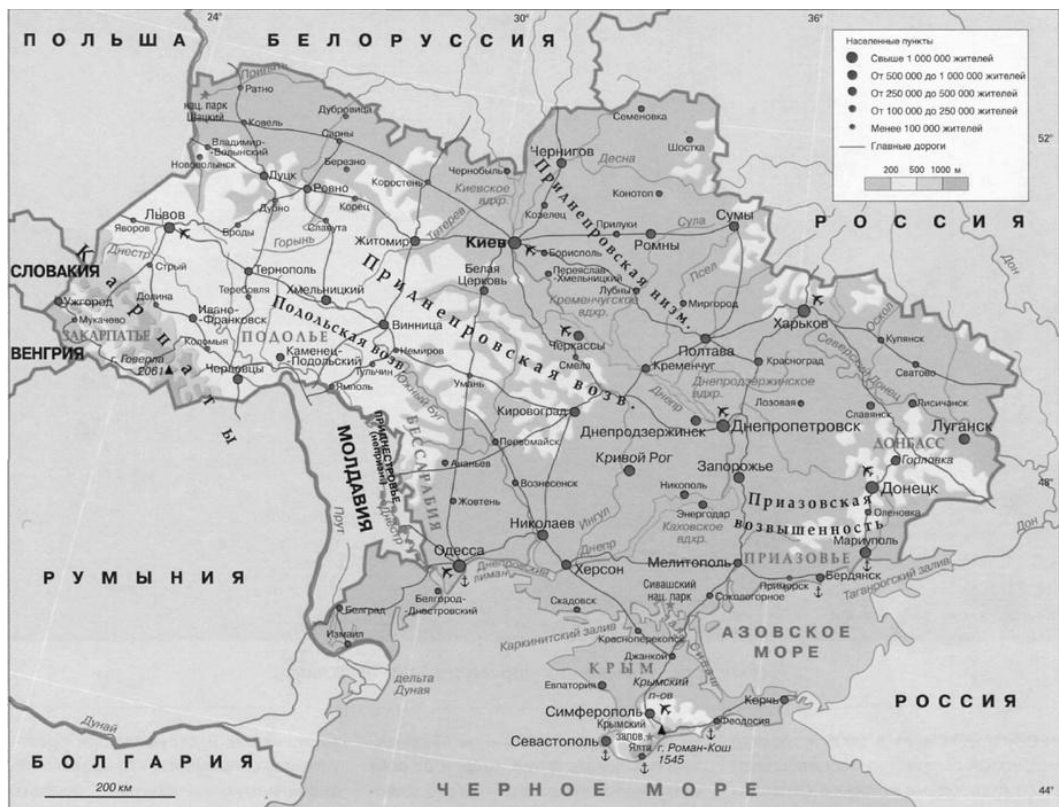
Рис. 1. Державний кордон України

Загальна протяжність державного кордону України становить близько 6800 км, з них довжина сухопутних кордонів України – 5638 км, морська межа території України – близько 1150 км. Наразі демарковано тільки 1391 км (24,5 %) сухопутної частини на заході (Польща, Словаччина, Угорщина, Румунія) і розмежовано близько 658 км (57,4 %) морських акваторій (Туреччина, Румунія). Решту сухопутної ділянки державного кордону тільки делімітовано (Росія, Молдова, Білорусь). Продовжується переговорний процес щодо розмежування морської частини кордону з Росією. Неврегульованими також залишаються точки стику кордонів [4].