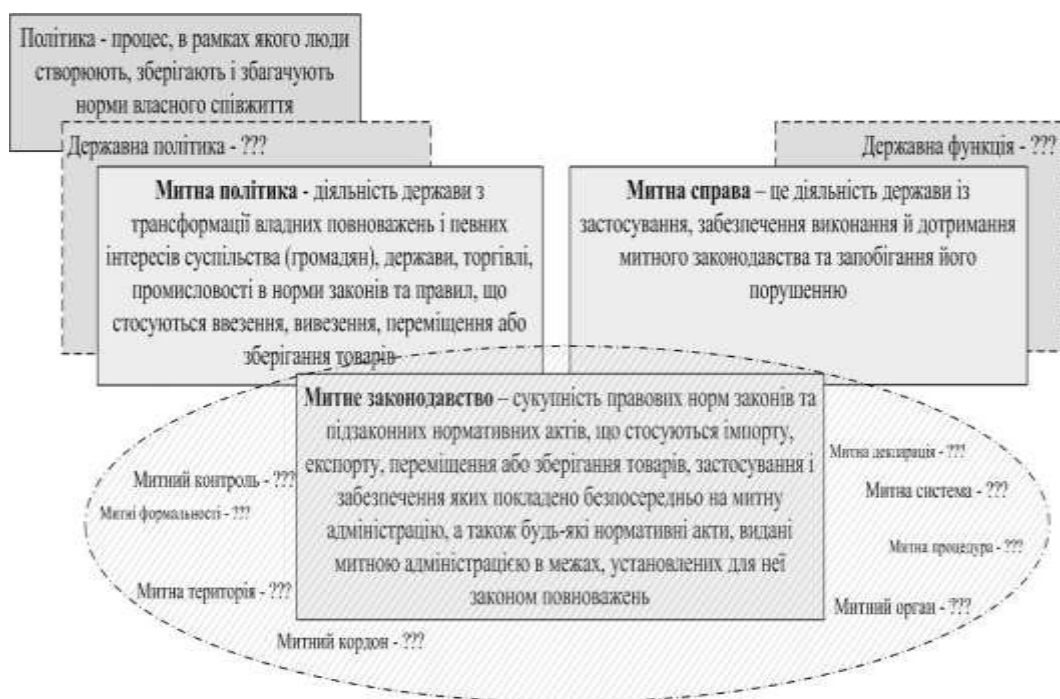
Рис. 3. Взаємозв'язок елементів “дерева” базових і похідних термінів з митної тематики

Висновки з даного дослідження і перспективи подальших розвідок у даному напрямку. Запропоновані визначення та тлумачення понять “митна політика”, “митна справа” і “митне законодавство” [3] (наведені на рис. 3) сприятимуть гармонізації підходів до формулювання в законодавстві України не тільки означених понять, але й подальшій розбудові зрозумілого і несуперечливого “дерева” основних митно-правових понять, таких як “митні формальності”, “митна процедура”, “митна система”, “митна територія”, “митна декларація” тощо, з'ясування сутності та змісту яких потребує додаткового розгляду.