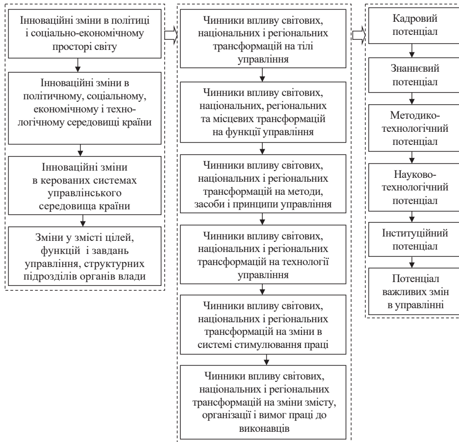
Рис. 1. Схема формування трансформацій у діяльності органів виконавчої влади

Щоб уявити горизонти змін і отримати інформацію стосовно необхідності і можливості змін системі управління, а також зрозуміти організацію діяльності органів виконавчої влади, доцільно використати схему, наведену на рис. 1. Вона являє собою блокову побудову етапів дослідження, що виникають у суспільстві змін, їх зміст і послідовність здійснення. Перший блок і його етапи спрямовуються на дослідження видів світових і національних трансформацій у суспільстві і їх впливу на внутрішні зміни в системі управління, шляхом оцінки і порівняння їх взаємопов'язаності. На другому етапі аналітичний блок призначений для визначення напрямів впливу трансформацій різних рівнів на складові елементи управлінської праці, її цілі, зміст і функції, методичний інструментарій і технології процесу здійснення.