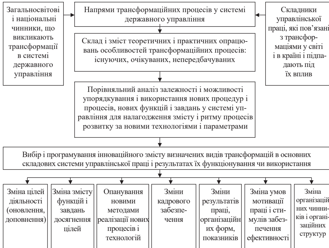
Рис. 2. Модель визначення видів, напрямів і змісту трансформаційних перетворень діяльності органів виконавчої влади

Застосування запропонованого методичного підходу до визначення напрямів трансформаційних процесів і здійснення їх атестації в нових умовах дозволяє створити умови для розвитку кожного складника праці до найвищого рівня їх розвитку. Процеси трансформації і алгоритми їх побудови наведено в моделі на рис. 3.