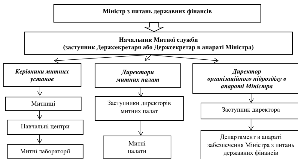
Рис. 1. Організаційна структура Митної служби Республіки Польща

Структурно Митна Служба Республіки Польща представляє собою класичну систему із лінійним підпорядкуванням (рис. 1.). У цьому сенсі управлінська модель Митної служби, а отже, і системи запобігання та протидії незаконному переміщенню товарів через митний кордон відповідає характеристиці максимально простого та гармонізованого функціонування. Відповідність принципам функціонування управлінських моделей систем запобігання та протидії незаконному переміщенню товарів через митний кордон представлено в таблиці 1.