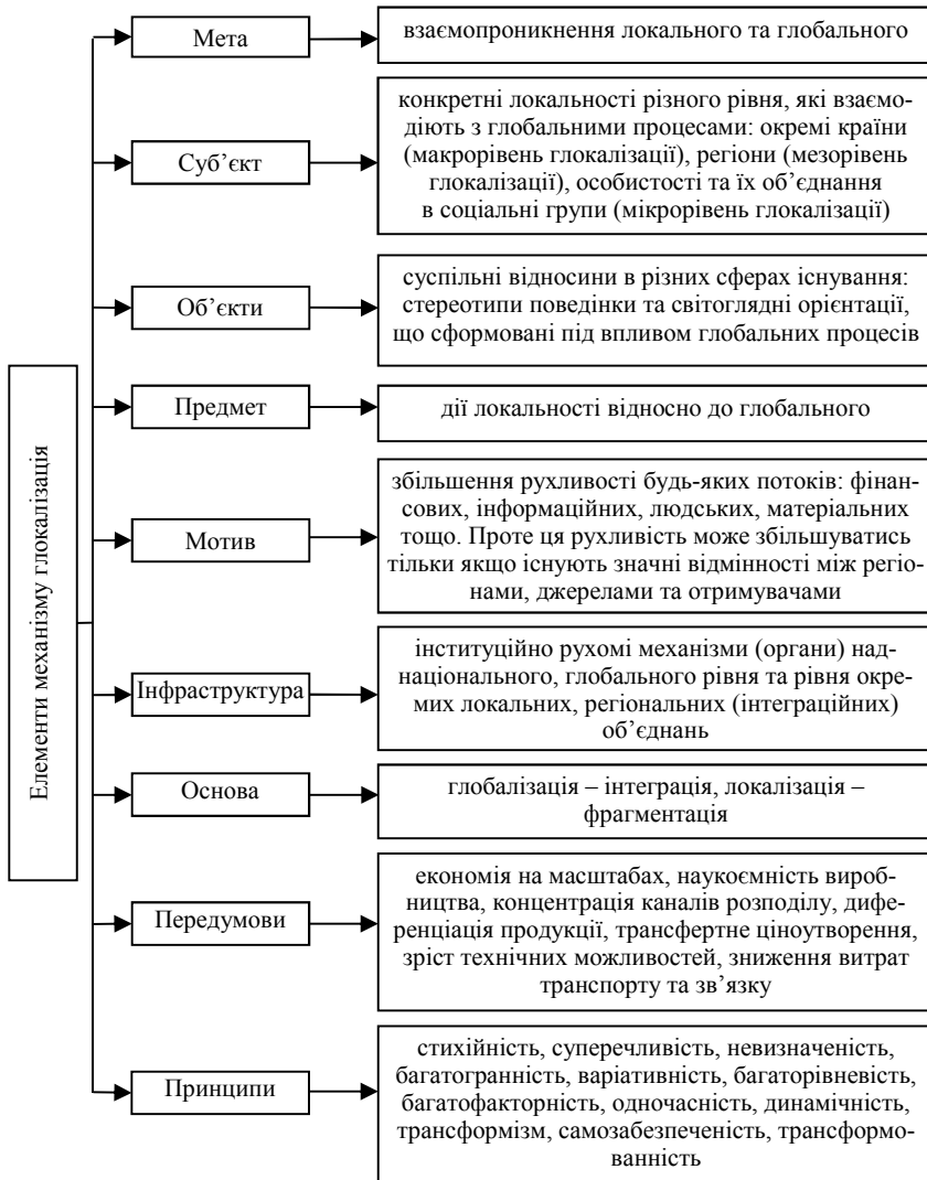
Рис. 3. Елементи механізму глокалізації [12-14]

силення, а замість злиття та уніфікації виникають та набирають сили такі явища, як: загострення інтересу до локальних відмінностей, до національних традицій, відродження діалектів, активізація регіонального (транскордонного) економічного та політичного співробітництва.