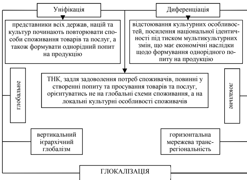
Рис. 2. Подвійний характер глокалізації

– «регкал» (англ. «regcal») – гібрид, введений С. Тай та Й. Йонгом для характеристики взаємовідносин в рамках регіональної та локальної бінарності.