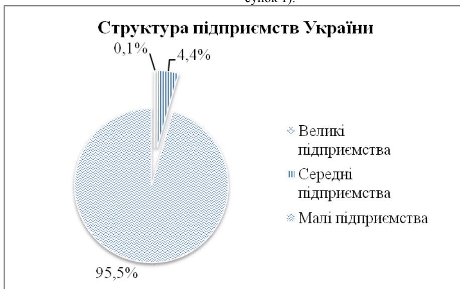
Рисунок 1 - Структура підприємств за розмірами у загальній кількості підприємств України станом на 2016 рік [3]

За даними Держкомстату України станом на 01.01.2016 р. в Україні у структурі вітчизняного підприємництва за розмірами підприємств частка малих підприємств має найбільше значення на відміну від великих і середніх і становить 95,5% (рисунк 1).