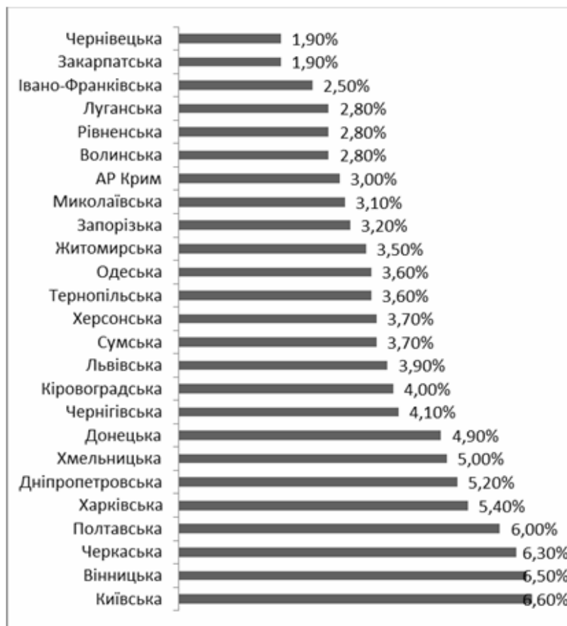
Рис. 3. Рейтинг регіонів за обсягом виробництва валової продукції сільського господарства у 2012 році [3]

Склалися така ситуація: з 10 областей, виробництво валової продукції сільського господарства яких найбільше, лише 4 області мають приріст валової продукції: Київська – 8,5%, Хмельницька – 15,3%, Чернігівська – 1,0%, Львівська – 4,2%; інші 6 областей мають зменшення виробництва продукції. Серед усіх областей найбільше зменшення у 2012 році має Дніпропетровська область (-20,3%).