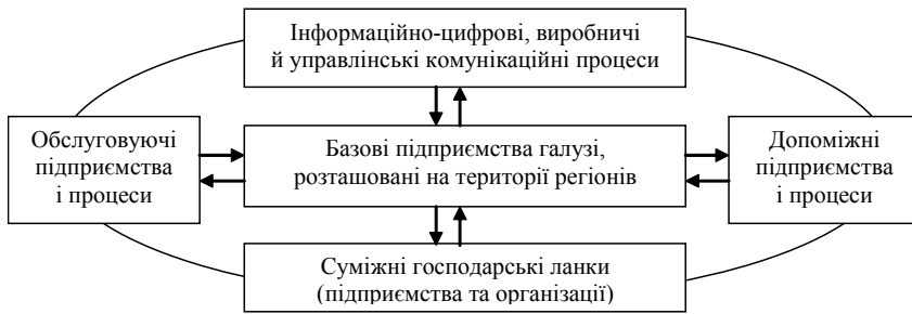
Рис. 1. Логико-структурна модель галузі матеріального виробництва

На рисунку 1 наведено альтернативні, найбільш поширені "блокові" структури галузей, які практично невід'ємні від головних підприємств галузевого господарського комплексу. Вони створюють архітектуру галузевої системи, а саме: