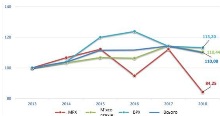
Рис. 2. Індекс споживання м'яса на людину (2013=100) [10]

до держави у вигляді податку на пальне, використане при виробництві сільськогосподарської продукції [12].