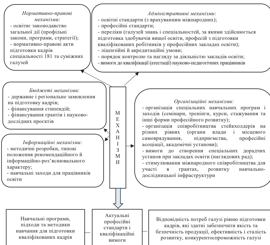
Рис. 4. Система механізмів державного регулювання підготовки кадрів з харчової промисловості

Отже, міжнародна співпраця є важливим фактором розвитку галузі харчової промисловості. При цьому доцільно сформулювати усі виокремлені механізми державного регулювання підготовки кадрів з харчової промисловості у систему (рис. 4).