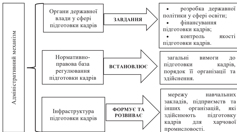
Рис. 2. Компоненти адміністративного механізму державного регулювання підготовки кадрів з харчової промисловості

Адміністративний механізм державного регулювання підготовки кадрів з харчової промисловості – це сукупність заходів, методів і процедур, що застосовуються органами державної влади для реалізації державних вимог до підготовки кадрів досліджуваної галузі (рис. 2).