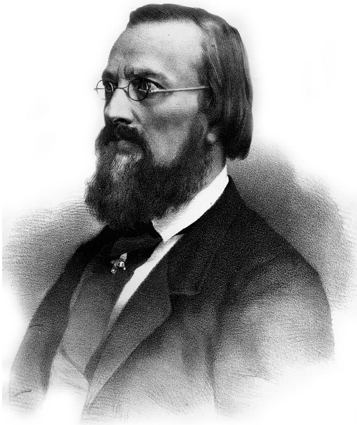
Портрет М. І. Костомарова, 1869 р.