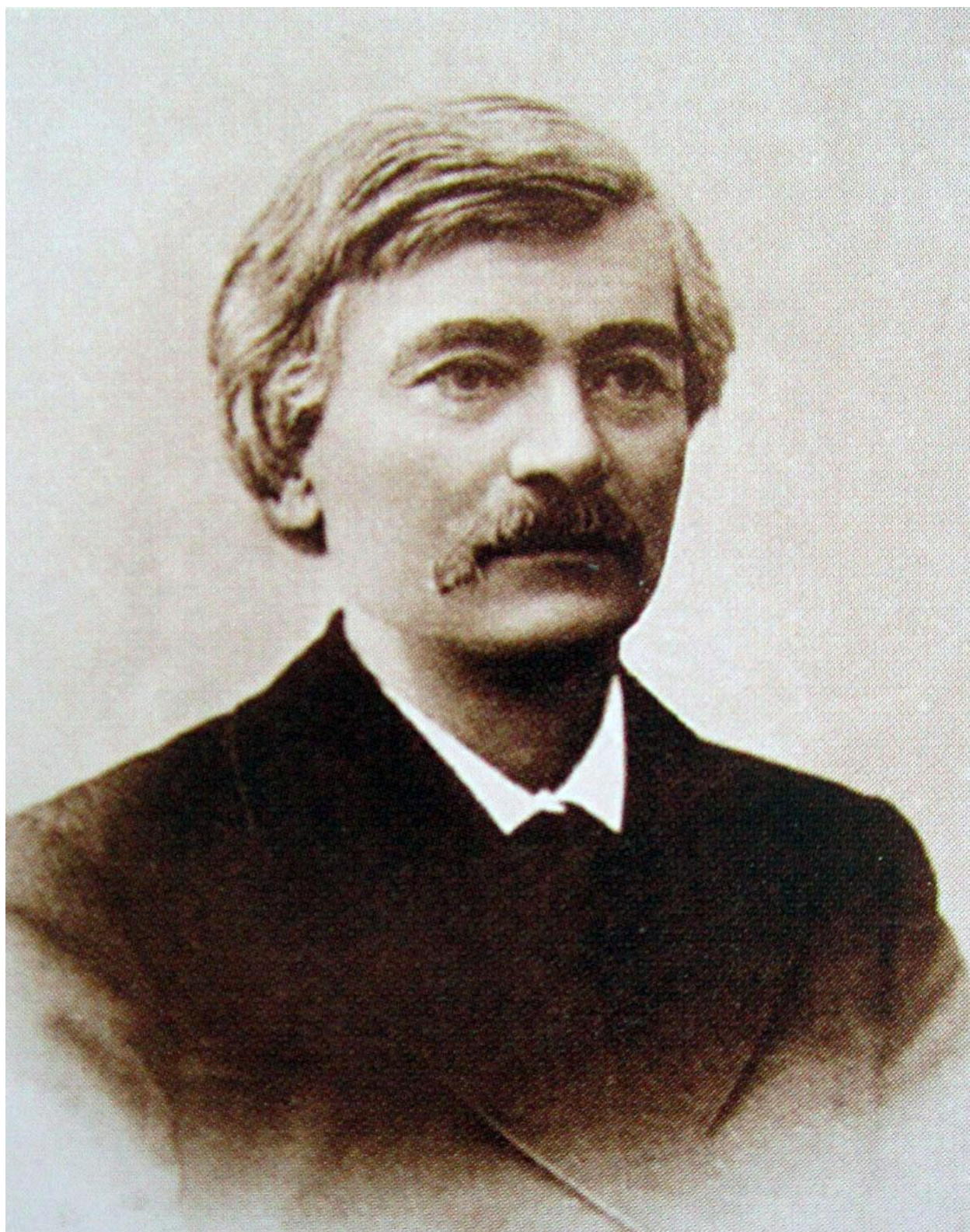
Портрет В.Б. Антоновича.