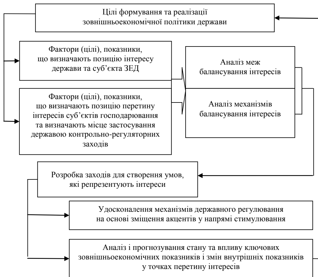
Рис. 1. Модель урахування інтересів під час прийняття рішень у державному регулюванні ЗЕД

Як циклічний процес моделювання врахування інтересів під час прийняття рішень у державному регулюванні ЗЕД, повторюючись, дає змогу виправити помилки, внести корективи в інформаційні основи моделі й тим самим розширити знання про об'єкт, поступово вдосконалити модель.