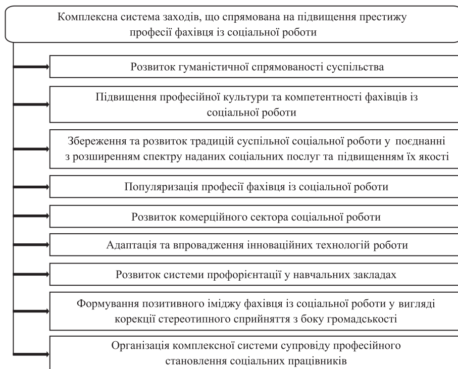
Рис. 2. Комплексна система заходів, що спрямована на підвищення престижу професії фахівця із соціальної роботи в Україні

3) збереження та розвиток традицій суспільної соціальної роботи у поєднанні з розширенням спектру наданих соціальних послуг та підвищенням їх якості. Особливе значення має активізація громадського сектору соціального захисту, що передбачає