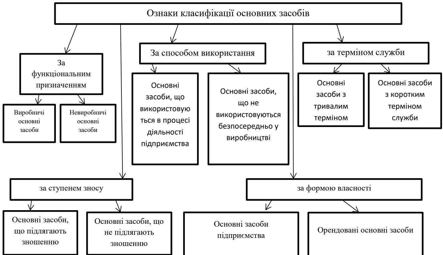
Рис.1.1. Класифікація основних засобів [17]

Ця класифікація дає змогу не лише організувати облік основних засобів, а й оптимізувати їх використання, враховуючи специфіку діяльності підприємства та розподіл витрат на утримання таких активів [9].