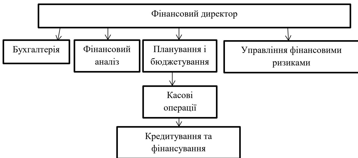
Рис.2.1. Схема організаційної структури фінансової служби підприємства «Джерело» [45]

Протягом практики я ознайомився з важливими організаційними аспектами діяльності компанії, зокрема з принципами фінансування виробництва, планування витрат на виробничі та адміністративні потреби, а також зі стратегією розвитку компанії, яка спрямована на покращення фінансової стабільності та інвестиційної привабливості.