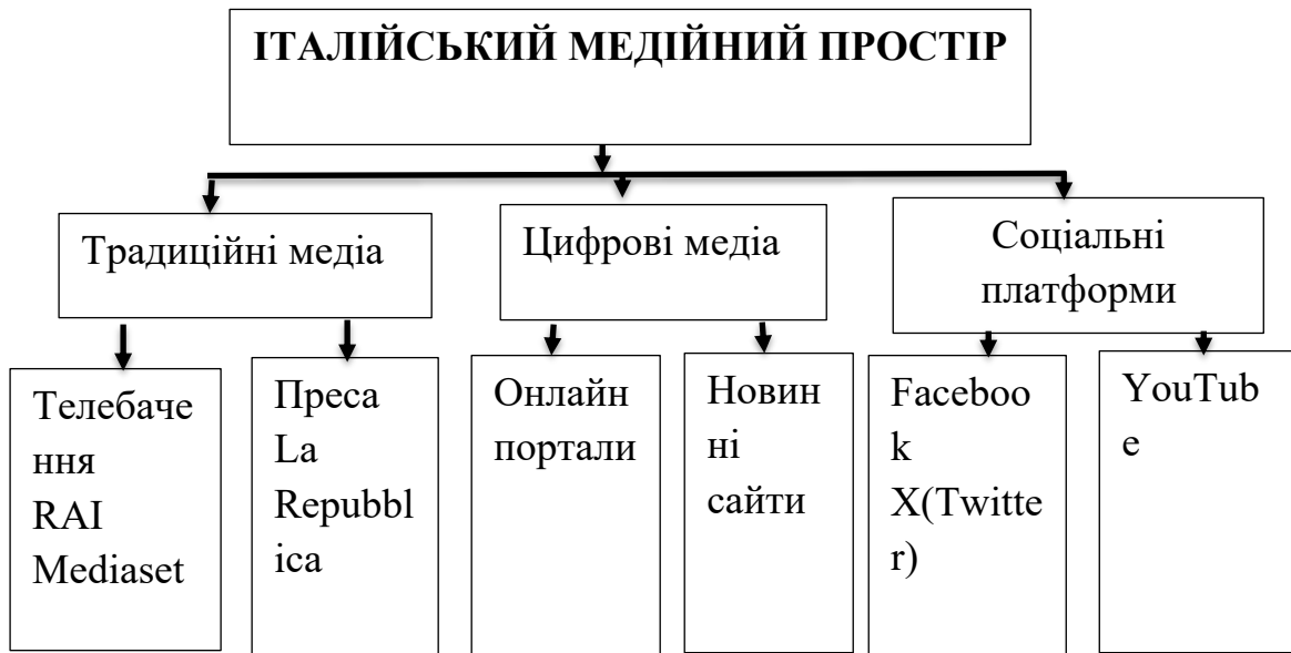
Рис. 2.1 Структура італійського медійного простору

Отже, медійний простір Італії є багатозаровою системою, яка включає традиційні й сучасні форми комунікації. Телебачення, друковані видання, онлайн-ресурси, радіо та соціальні мережі створюють інтегровану інформаційну структуру, що впливає на формування громадської думки. При цьому, телебачення залишається ключовим джерелом інформації для широких верств населення, завдяки оперативності висвітлення подій і охопленню значної аудиторії. Паралельно, онлайн-медіа та соціальні мережі грають провідну роль у прискоренні обміну інформацією, надаючи споживачам миттєвий доступ до новин. Цифрові платформи сприяють новим формам взаємодії між медіа та аудиторією, підтримуючи активні дискусії з актуальних суспільно-політичних тем. Радіо ж виконує допоміжну роль, забезпечуючи оперативне інформування та доповнюючи роботу інших медіа-каналів.